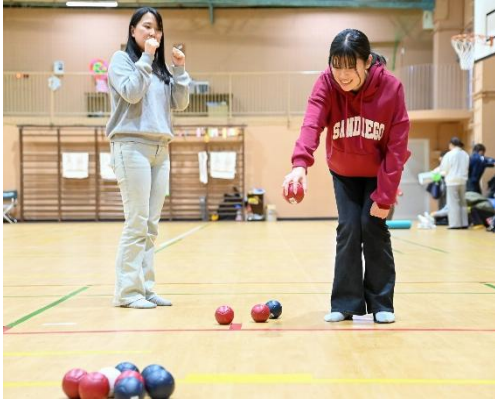
本学のポッチャサークル