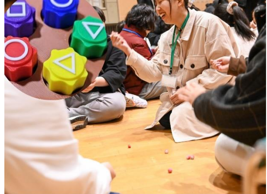
韓国版おはじき「コンギ」