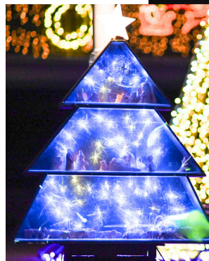
↑ イルミネーションの見どころ① 高さ6メートル強の巨大ツリー

本学正門付近にて、毎年恒例のクリスマスイルミネーションを点灯しております（12月3日～25日、17：00～21：00）。期間中どなたでもご覧いただけます。