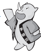
学研災キャラクター サイちゃん

病院実習中、実習先の 携帯電話を床に落とし、 破損させてしまった… → Cコース